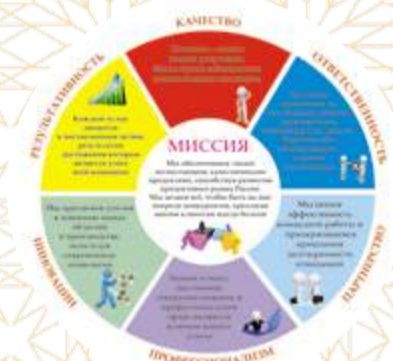
Теперь у нас есть миссия и ценности, с. 4