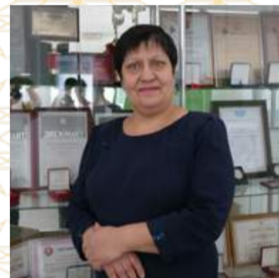
Это твоя работа, с. 2